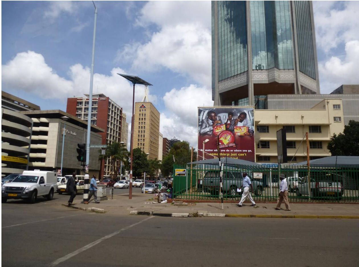
Foto: V uliciach Harare