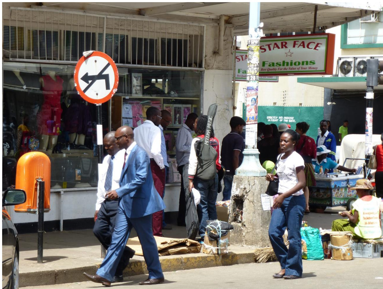
Rusna ulica v Harare

Institúcie, ktoré sme navštívili, boli napodiv veľmi slusne vybavené. Byval som v hoteli Meikles v centre mesta. Je to veľmi známy, tradičný hotel, asi najlepší hotel v meste. Bol naozaj na úrovni. Len som nemohol platiť kartou, nebralo mi ani jednu kreditku. Esteze som mal nejakú dolarovú hotovosť a tiež som si vybral z bankomatu. Oficiálna mena je tu US dolar. Mimochodom, niektoré dolarové bankovky sú tu také „vypotrebované“, že sa takmer rozpadávajú a pôsobia veľmi spinavým dojmom. Na recepcii hotela mi vyberali také tie lepšie, novšie bankovky, aby mi nevydali tie chatrajuce. Ocenil som to. A este musím dodať, že v Zimbawe som vôbec nemal roaming (Orange!), takže telefón mi bol celý čas nanič.