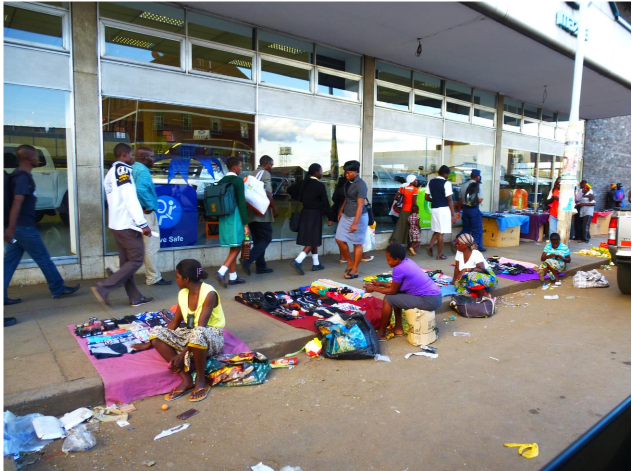
Foto: Poulicny predaj v Harare