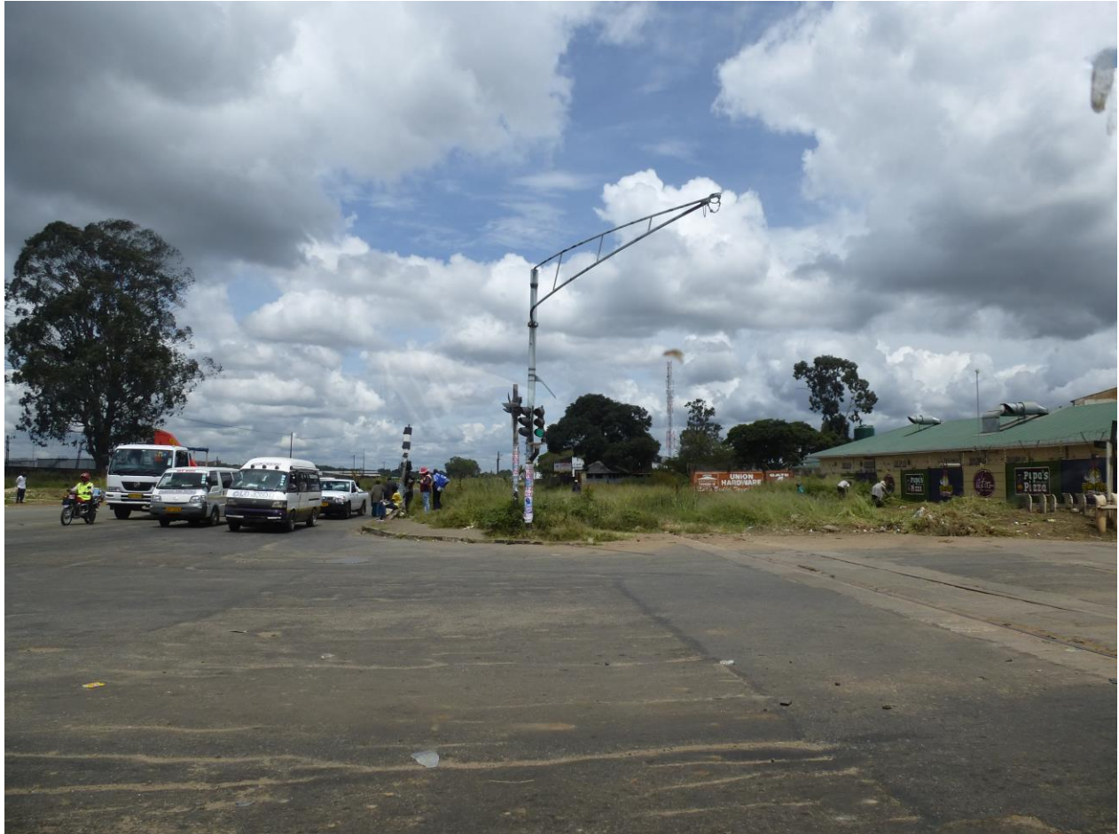
Foto: V uliciach Harare