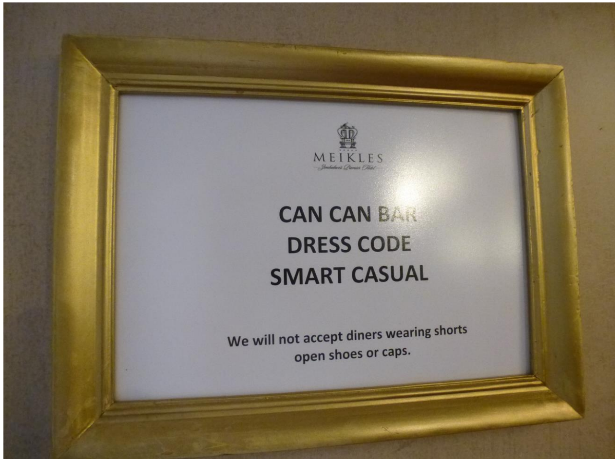
Foto: Dress code v bare hotela Meikles

Na druhy den sme este mali pracovny program v Harare. Tentoraz sme obedovali v meste, v restauracii hotela Jameson. Obed bol formou bufetu. Na doporucenie kolegu som ochutnal miestny pokrm pripraveny zo smazenych velkych husenic. Boli korenene a dost huzevnate, trosku skripali medzi zubami. Ale boli fajn. Volaju sa „Mopane worm“, podla toho, ze ziju na strome zvanom mopane. V jazyku Shona ich volaju „madora“. Vzdy sa snazim ochutnat miestne jedla a spoznat lokalnu kuchynu. Takisto som ochutnal malicke smazene rybky zvane „kapenta“. Zaujímavavy pokrm, tu velmi casty a oblubeny, je husta krupicova kasa ktora vyzerá ako cesto, vola sa „sadza“. Vecer sme odleteli späť do Johannesburgu, na letisku v Harare sme si este s kolegom dali miestne pivo a družne sme posedeli.