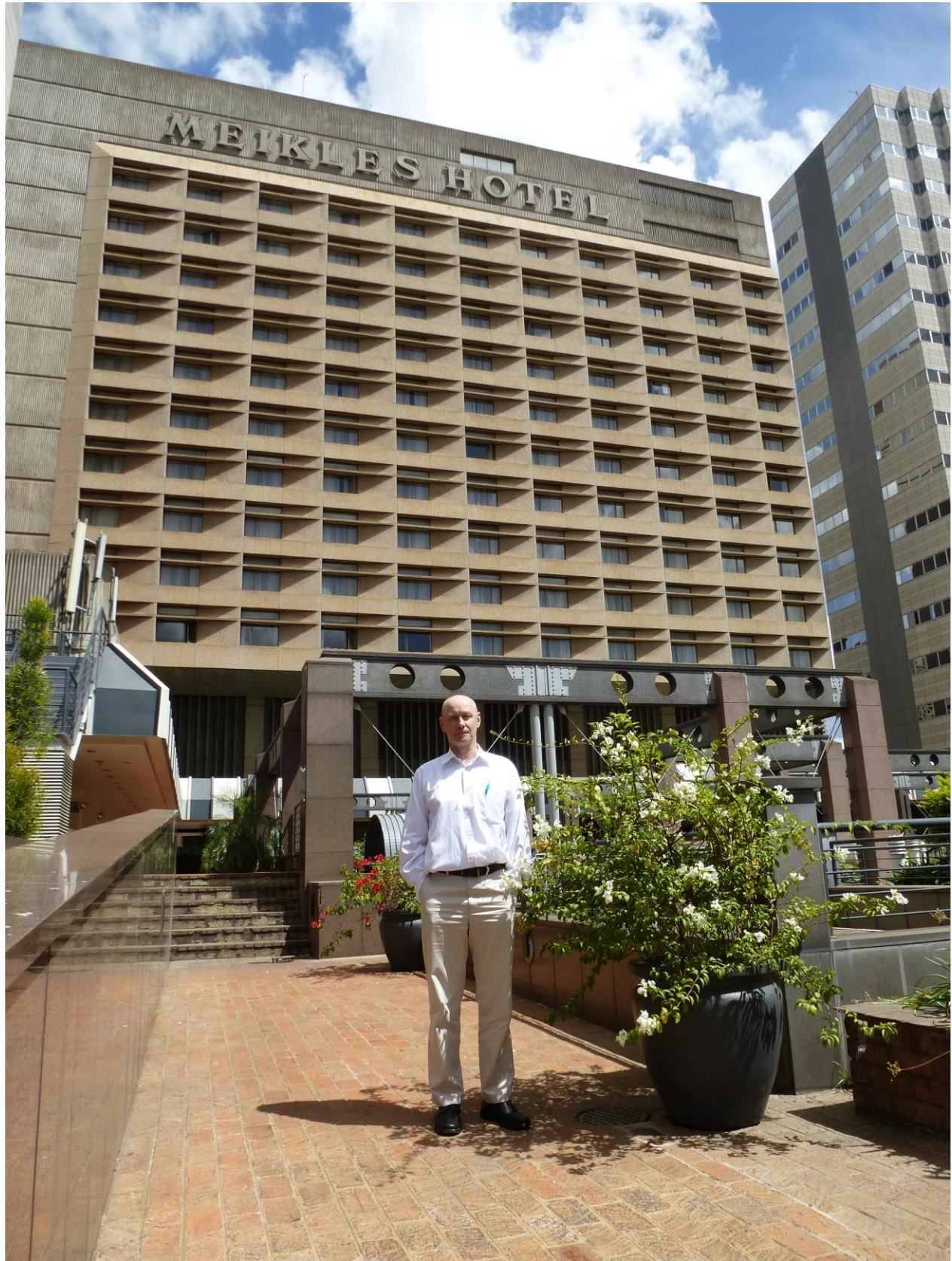
Foto: Pred hotelom Meikles