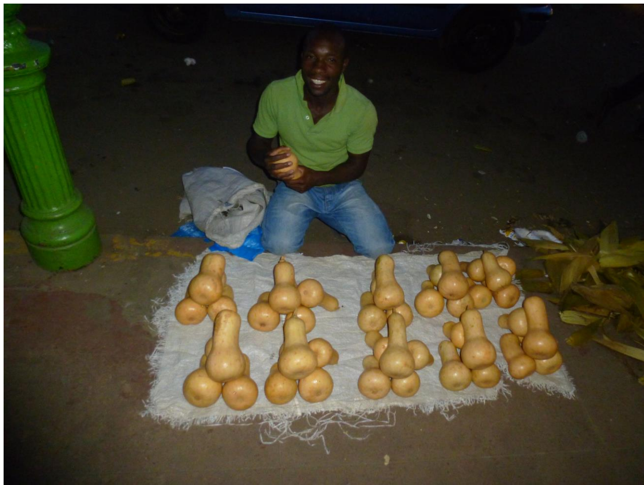
Foto: Vecerna ulica a predaj z chodnika v Harare

Dal som si este v bare drink pred spanim a pokecal som s barmanom. Pacil sa mi napis, ze do baru je vstup povoleny len vo vhodnom obleceni. Cital som sa tak „starosvetsky“.