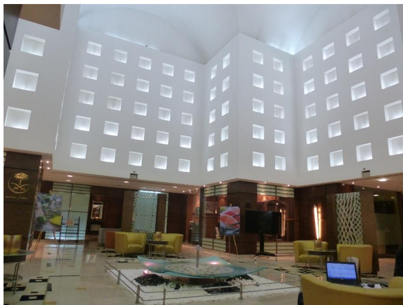
Foto: Zaujímavý interier hotela Radisson Blu Rijad