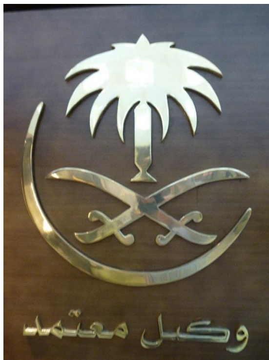
Foto: Saudsky symbol, plaketa umiestnena v hoteli

Vecer sa moji kolegovia vybrali do Mekky (vsetko Egyptania, moslimovia). Cca 1 hodina jazdy autom z Dziddy. Prejavil som zaujem ist s nimi, s tym, ze ich pockam „vonku“ a poprechadzam sa tam (vedel som, ze dovnutra Mekky maju pristup len moslimovia). Ale kolega ma okamzite zacal odhovarat. Situacia je nasledovna: kontrolne stanoviste je cca 1 km pred komplexom v Mekke/Medine, priamo v pusti. Nie je vlasne kde cakat a prechadzat sa, udajne tam nic nie je. Keby som sa pokusil preniknut s nimi v aute dovnutra komplexu a straze by to odhalili, skončili by sme vsetci vo väzeni s vaznymi nasledkami (kolegov by navzdy vyhostili z krajiny, co by cakalo mna, to neviem). A podla vyzoru/tvare by ma vraj hned odhalili. Tak som to nakoniec vzdal a zmieril som sa s tym, aj ked nerad. Nechcel som vsak narobit problemy a skomplikovat zivot sebe aj ostatnym.