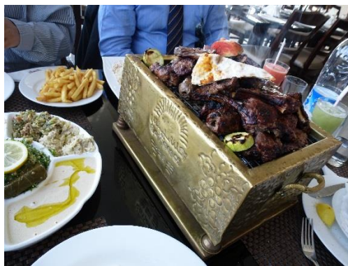
Foto: Grilovana misa v restaurácii Ramesse, Dzidda