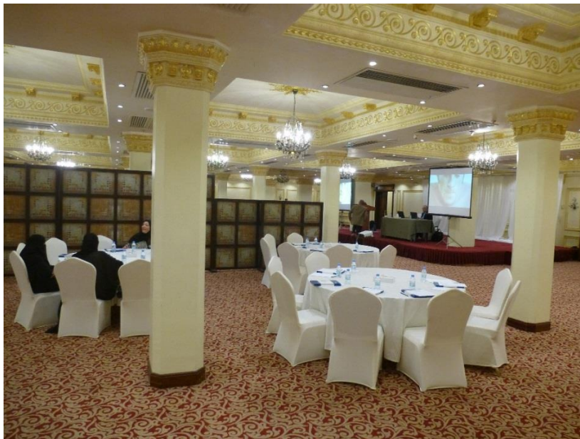
Foto: Oddelena zenska cast (v popredi) a muzska cast (za deliacou stenou)

Ked sa kona nejake podujatie (ako napr. nase seminare), vacsina hotelov vyzaduje uradne povolenie, ze zeny sa mozu zucastnit spolu s muzmi. V Rijade boli zeny spolu s muzmi v jednej miestnosti, aj ked sa zoskupili oddelene, takze nesedeli pri stoloch s muzmi. Hotel Movenpick v Dzidde povolenie nevyzadoval, ale v konferencnej miestnosti bola postavena vysoka stena, ktora oddelovala muzsku a zensku cast auditoria. Zeny mali aj svoje vlastne projekcne platno, a ja som sa musel pocas prezentacie pohybovat tak, aby som bol v kontakte s obidvomi skupinami. Beztak prislo len niekoľko zien, drviva vacsina ucastnikov boli muzi (v Europe je to presne naopak).