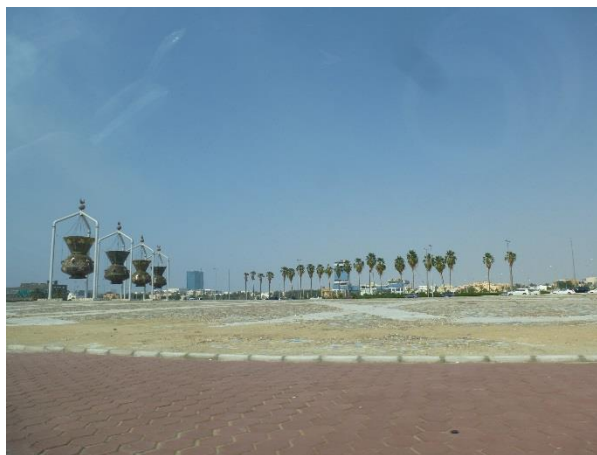
Foto: Zaujímavé ozdoby v exteriéri