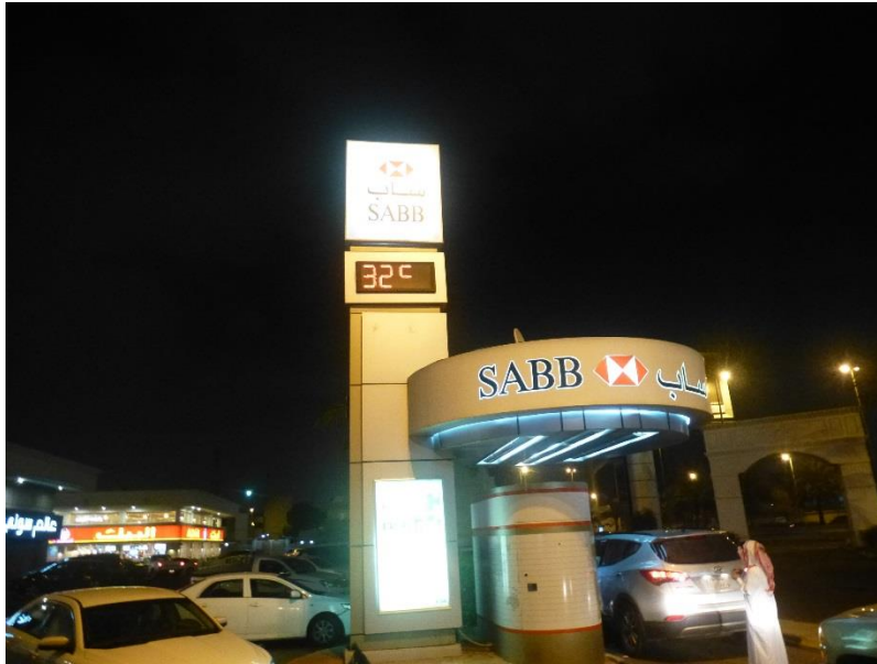
Foto: Vyber hotovosti z bankomatu spoza volantu auta, americky styl. Teplota 32 st. o 11-tej vecer

Prichod do Dziddy znamena zmenu klimy . Rijad je suchy a chladnejši (v tomto období v polovici decembra su denne teploty cca 25 stupnov, nocne cca 15 st. Ale v Dzidde je extremne vlhko (od mora) a teplo. Bolo tam cez den vyse 35 stupnov. Vecer som sa bol prejsť v okolí hotela, a o jedenastej vecer bolo este 32 stupnov! Inak letne teploty dosahuju v Saudskej Arabii az do 50 stupnov a vlhkost v Dzidde je vtedy udajne neznesitelna.