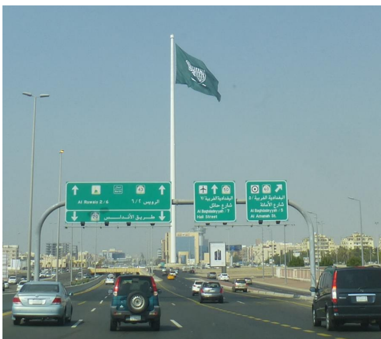
Foto: Obrovská, najvyššia vlajka v Saudskej Arabii, Dzidda

Odlet domov v piatok skoro rano. Na letisku v Rijade riadny naval ludi, napriek tomu, ze bolo pol piatej rano. Zacinal vikend. Sofer mi povedal, ze teraz rano v rovnakom case odlieta viacero letov do Bangladesa, Pakistanu a pod. A skutocne, 99% ludi na letisku boli muzi s indickym vyzorom s kopou batoziny. „Gastarbeiteri“ sa vracali domov na navstevu. Inak vsimol som si, ze bezpecnostny personal na letisku (co su zrejme original Saudi) zaobchadza s tymito ludmi dost hrubo a nezdvorilo, dokonca na nich niekedy zvsuju hlas, posuvaju ich ako figurky, davaju im strohe prikazy. Zdalo sa vsak, ze ti su na to zvyknuti. Zeny maju svoj vlastny koridor pre pasovu a bezpecnostnu kontrolu.