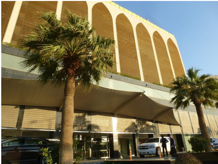
Foto: Priečelie hotela Radisson Blu v Rijade. Celý je akoby „obalený“ tieniacou štruktúrou, za ktorou sú ukryté samotné okna. Zaujímavá architektúra.

Vonku ma už čakal sofer z hotela Radisson Blu. Bol to Bangladesan, ako väčšina ľudí pracujúcich v Saudskej Arabii. Pracuje tam tiež veľa Pakistancov aj Egypťanov, teda mužov pochádzajúcich z moslimských krajín. Saudskú Arabiu obýva 30 mil Saudov a cca 10 mil cudzincov pracujúcich tam dlhodobo. Ale získať a obnoviť pracovné povolenie nie je jednoduché, vládne tam veľká byrokracia a veľmi prísne pravidlá. Viem to od našich obchodných partnerov, ktorí sú pôvodom Egypťania a pracujú tam.