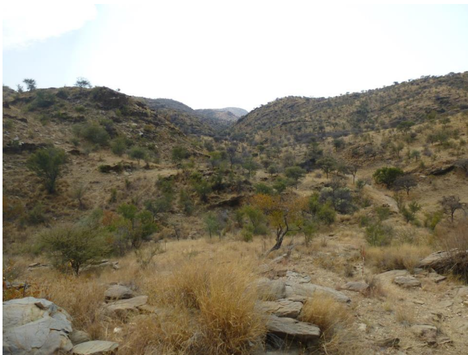
Foto: Chodník zostupuje do roklin

Chodník zase zostúpil do údolia. Boli tam take uzke rokliny v ktorých bolo trosku viac vlhkosti a rastlo tam aj viac zelených drevín. Zaujali ma vtacie hniezda visiace jedno pri druhom z konárov veľkeho stromu. Z korún niektorých stromov sa ozývalo intenzívne bzucanie, zrejme to boli kolónie hmyzu, ktoré sa tam ukryvali.