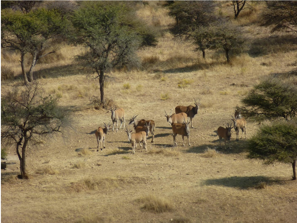
Foto: Antilopy v udoli