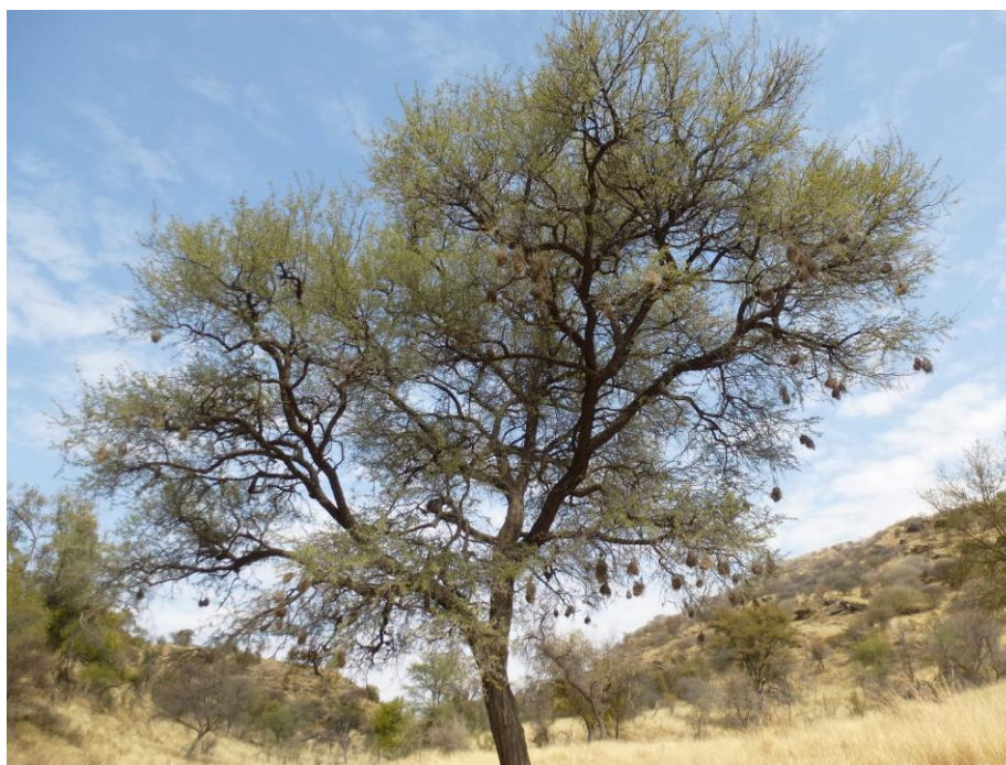
Foto: Hniezdenie operencov na stromoch v údolí