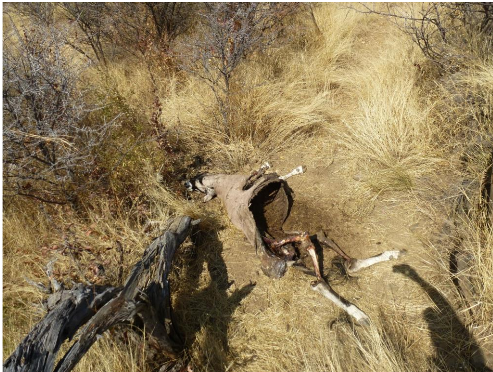
Foto: Tato antilopa to uz ma za sebou