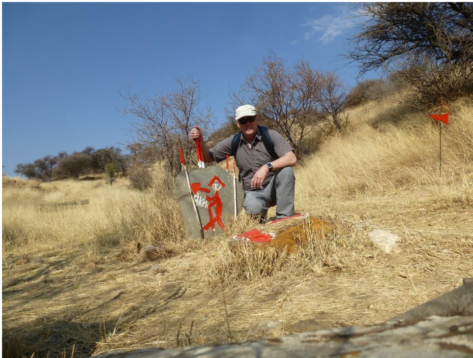
Foto: Miestne turisticke znacenie

Znacenie trasy bolo opät velmi zaujimave a pre mna nezvycajne. Cervene znacky na kovovych tyciach.