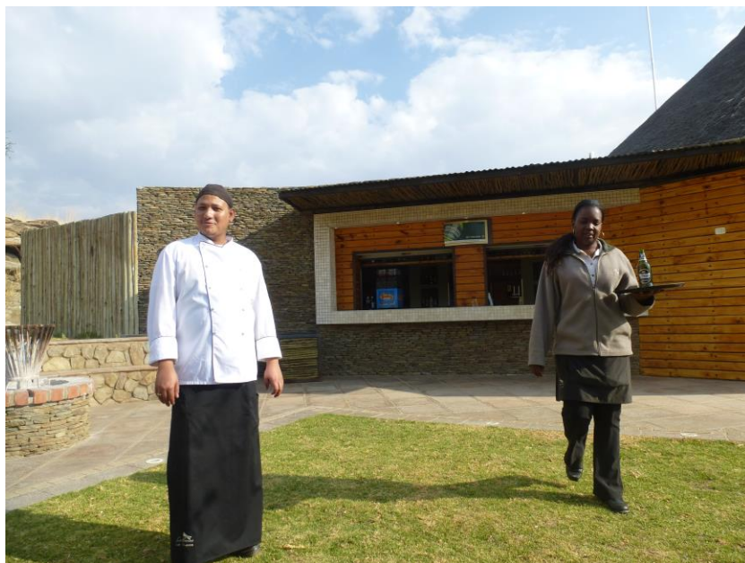
Foto: Moja casnicka prinasa moje pivo

Po ploche tabora sa potulovalo množstvo zvierat. Prasiatka, pstrosy a hlavne paviany. Niekoľko mladých pavianov sa prechádzalo okolo bazena, len niekoľko metrov odo mňa. Prehrabávali sa v trave, snorili po okolí, hľadali zvyšky jedla.