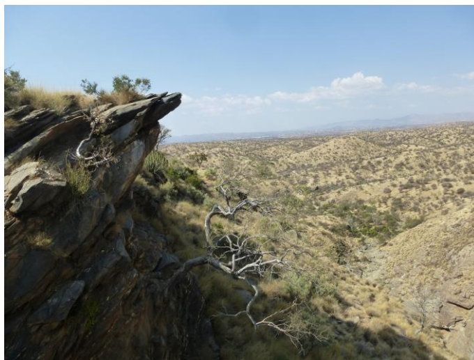
Foto: Vyhlady zo skaly nad priehradou