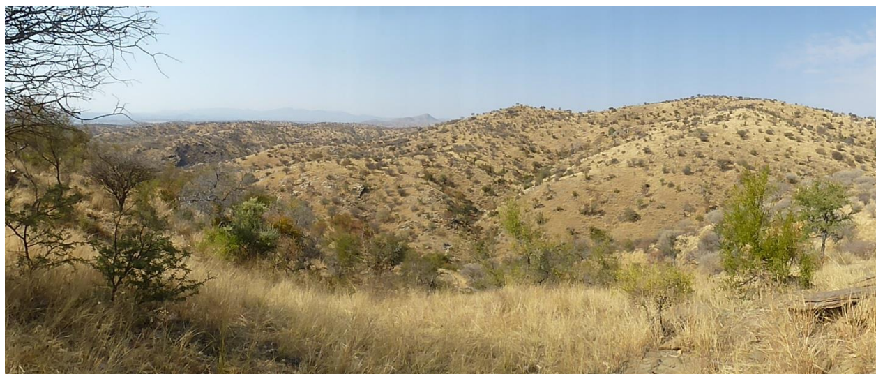
Foto: Vyhlady z hrebena do okolitej krajiny.

Z jedneho miesta na hrebenu bolo vidno dole rozlahlu cistinu, na ktorej sa paslo stado antilop (myslim, ze kudu). Bolo to dost daleko, ale pomocou zoomu som spravil nejake fotky. Kym som stal, dobehli ma dve turistky v strednych rokoch. Ked som videl, ze sa hrnu dalej, upozornil som ich na antilopy dole. Hned sa zastavili a vytiahli fotaky.