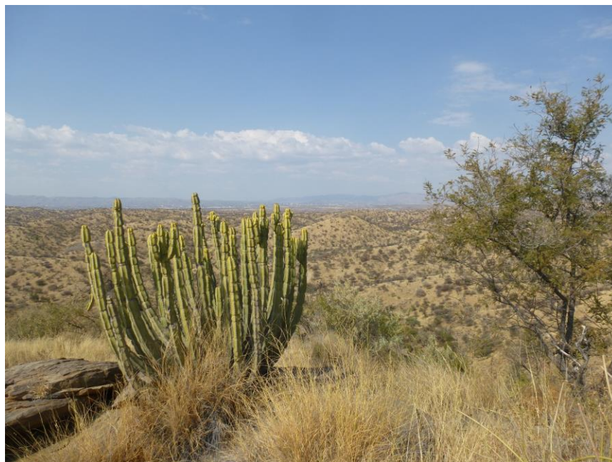
Foto: A este viac vyhladov zo skaly nad priehradou