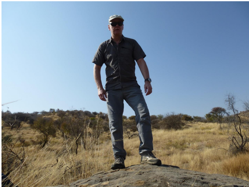
Foto: Na pahorku