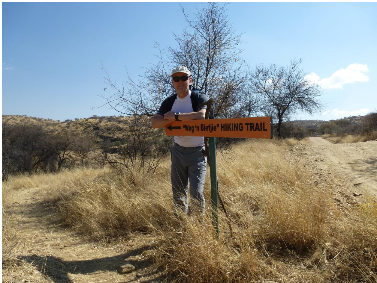
Foto: Na zaciatku znacenej trasy