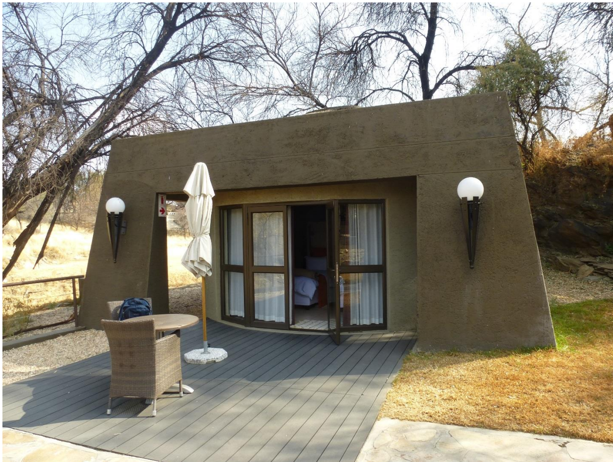
Foto: Moj bungalow v Daan Viljoen

Dostal som kluc a prisiel som k svojej chatke. Velmi pekna a necakane komfortna. Velka postel, zachod, sprcha, vsetko v typickom africkom style.