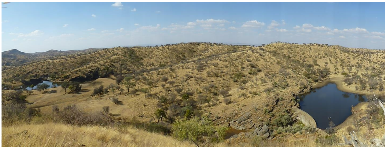
Foto: Panoramatický výhľad z kopca

Rozhodol som sa vyliezt na najbliži vyší kopec, aby som získal lepší výhľad a prehľad. Stalo to za to. Krasný panoramatický výhľad na celé okolie do diaľky, podo mnou dve vodné nádrže, ktoré lakali zver.