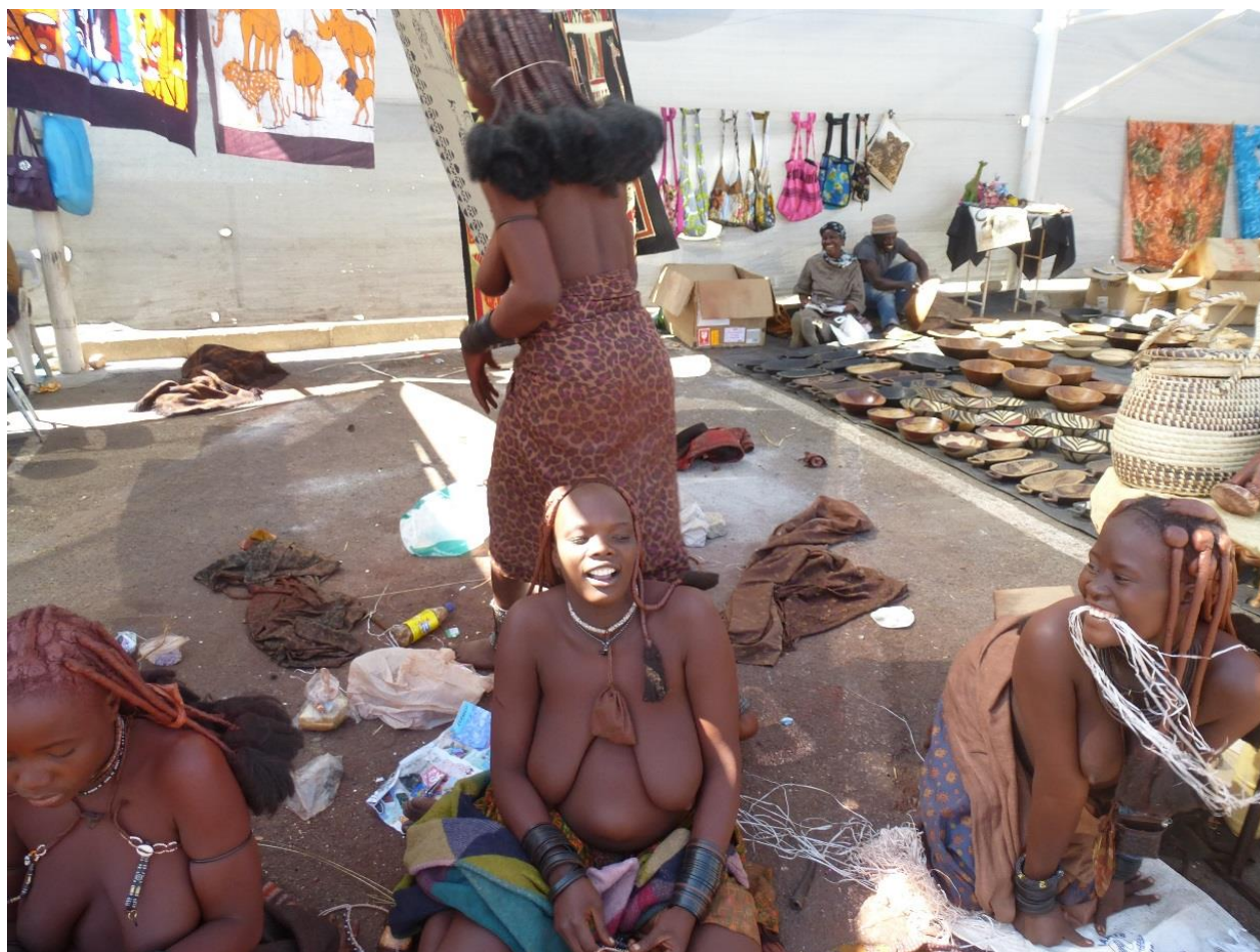
Foto: Domorode ženy na trhu. V strede sa usmieva ta, od ktorej som si kupil naramok. Chrbtom sa otocila a dozadu odchadza jej suseda, od ktorej som si nic nekupil.

Bol som sa prejsť po meste v okolí hotela a natrafil som na trh, kde domorode ženy predávali svoje výrobky, aj ich na mieste vyrabali (napr. naramky a privesky). Okolo sa motali malé deti. Bolo to dosť exotické, zjavne boli z vidieka, oblecené (resp. čiastočne oblecené) v domorodých odevoch. Vzhľadom na ich polonahotu „hore bez“ bol značný záujem zo strany okoloidúcich turistov o fotenie. Ženy sa však vykrucali a schovávali, žiadali najprv o zakúpenie ich tovaru. Tak som kupil niekoľko naramkov od jednej zo žien. Tá bola spokojná a nechala sa vyfotiť a nafilmovať. Jej susedka sa však urazila, že som si to nekúpil od nej a pri fotení usla dozadu a sadla si ďalej. Podobná scenka s malou hádkou medzi ženami sa zopakovala o kusok ďalej. Neviem síce presne, o čo išlo, ale nedalo mi a dohovaral som im, aby sa nehadali. Tak sa ukludnili a natočil som si ich. Ale samozrejme najprv som si kupil nejakú drobnosť.