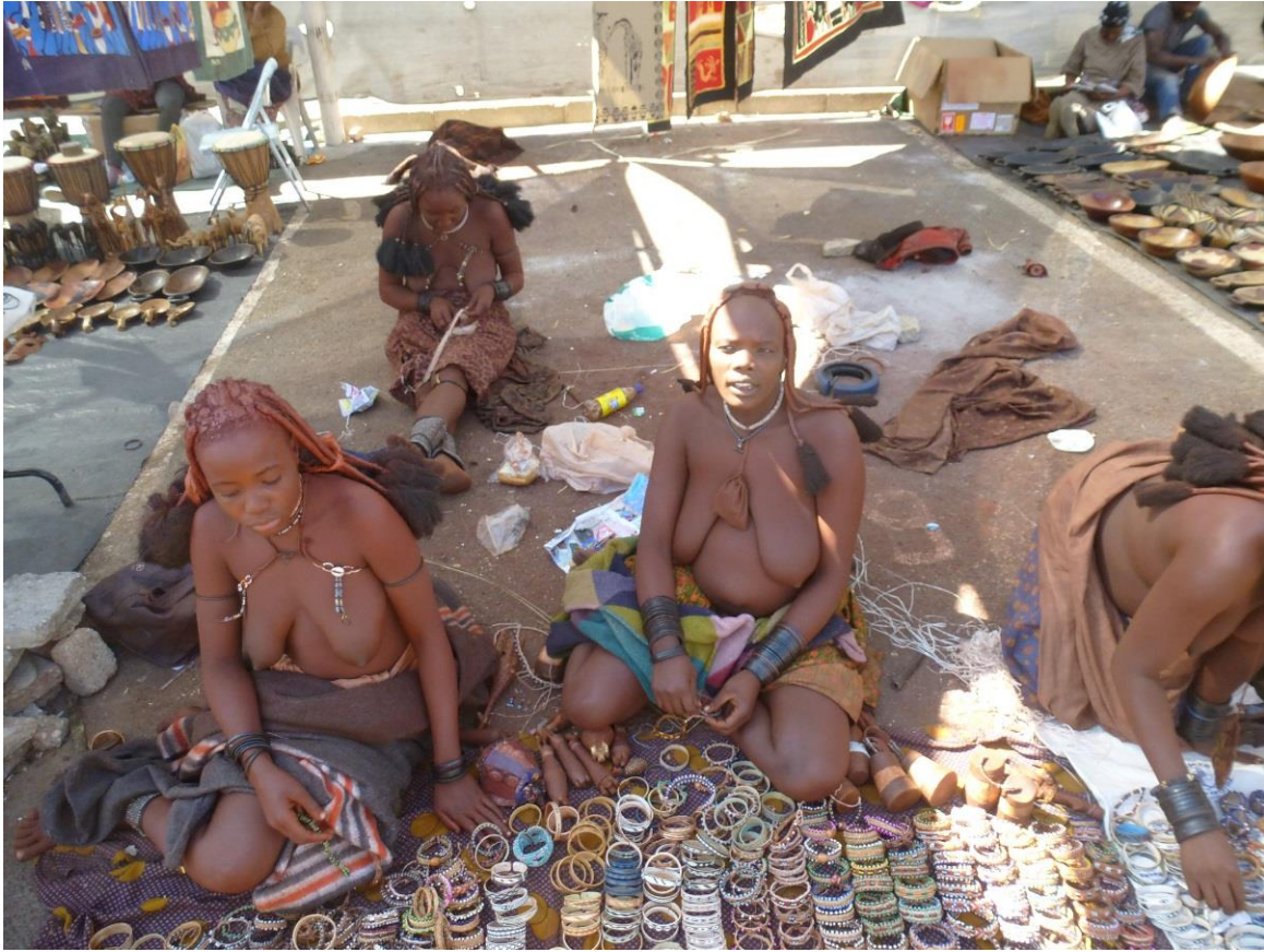
Foto: ... a ich výrobky

Velmi zaujimave boli ich ozdoby vlasov. Na tieto pricesky, „extensions“, som si uz u zien v Afrike zvykol. Tu to vsak bolo ine, take folklorne, bol to domorody odev. Uchytenie ozdob na hlave bolo velmi zvlastne, boli akoby prilepene. Snad je to fotkach aspon trosku vidiet.