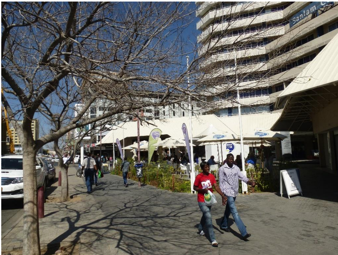
Foto: V uliciach Windhoeku