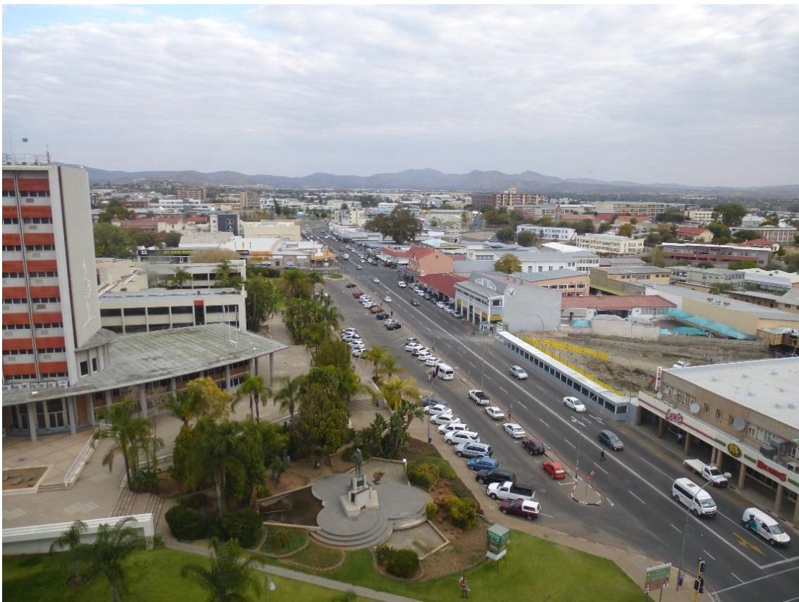
Foto: Jedna z hlavných ulíc vo Windhoeku

Celkovo som mal z Windhoeku dobry dojem, mesto je slusne upravene a ciste, je tam vyrazne viditelny zapadny vplyv.