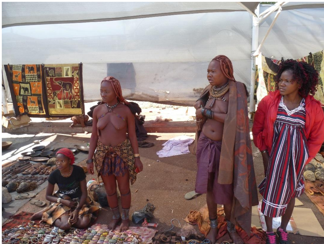
Foto: Vyjednavanie o cene, nasledovala kratka hadka medzi tymito zenami