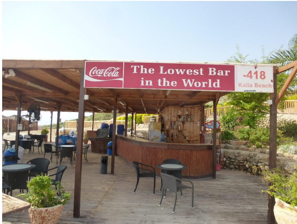
Foto: Najnizsie polozeni bar na svete, nadmorska vyska -418 m, Kalia Beach