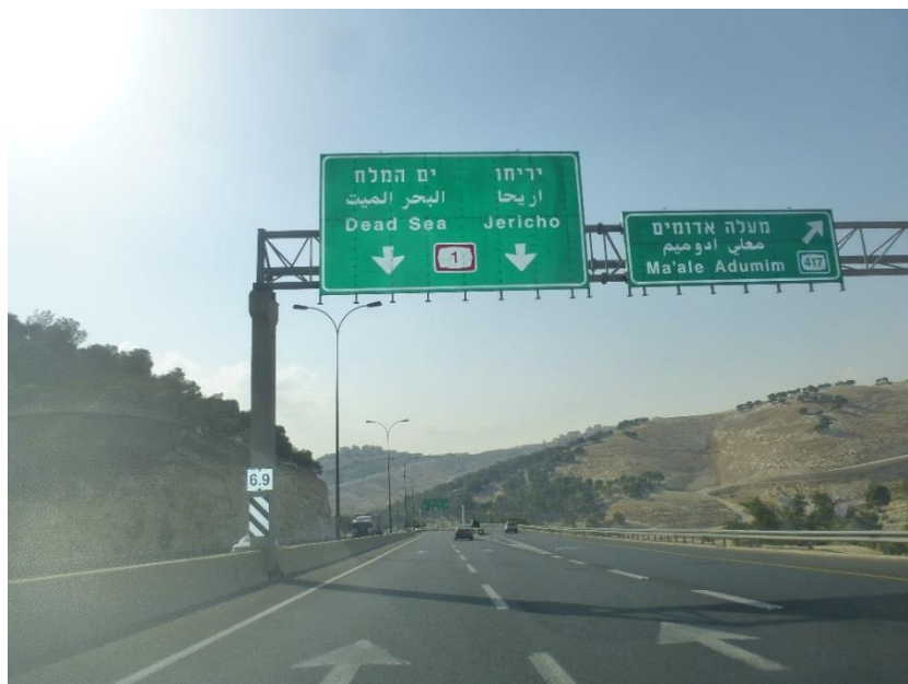
Foto: Na ceste k Mrtvemu moru

Tentokrat nam casovy rozvrh umoznil aj kratke zastavenie sa pri Mrtvom mori a bleskovu navstevu Jeruzalemskeho stareho mesta.