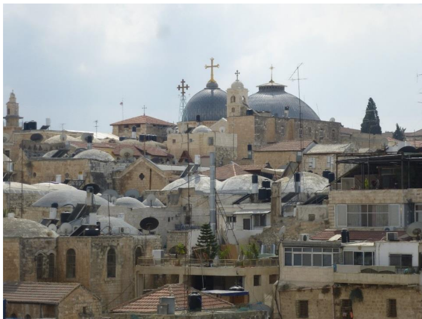
Foto: Strechy starého mesta Jeruzalema, na vrchole vidno kupoly Chrámu Božieho hrobu