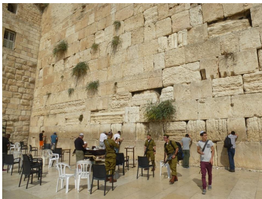
Foto: Západný múr, Múr nárekov