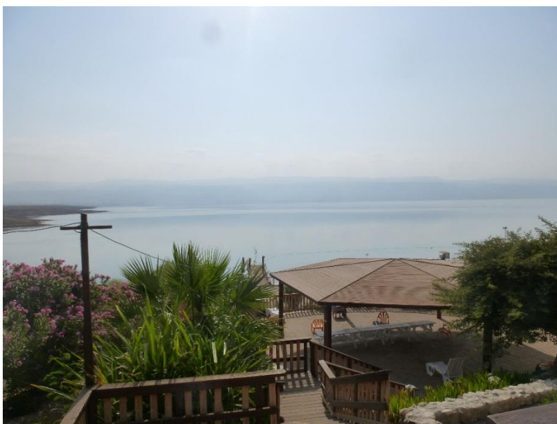
Foto: Hladina Mrtveho mora

Vstup k vode je spoplatneny, je to vlasne rekreacne stredisko. Kupanie v Mrtvom mori je zvlastny zazitok. Voda je dost agresivna a vsade su napisy varujuce pred vstupom do mora s otvorenymi poranieniami na kozi a rozhodne si treba chranit oci. Ked si na vodu lahnete na chrbat, mate problem znova sa postavit nohami na dno, taky odpor voda kladie.