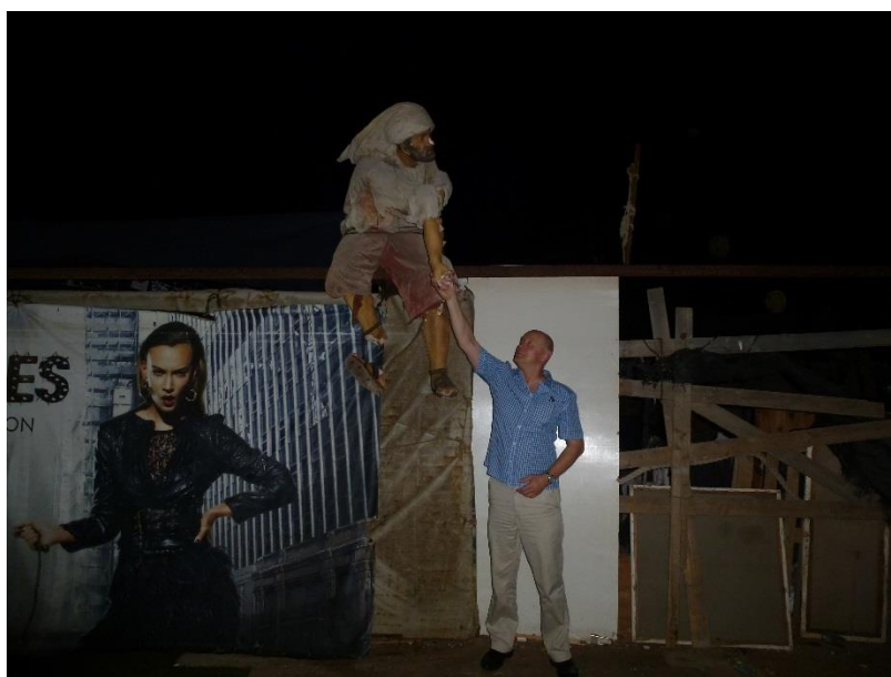
Foto: Nocne potulky po plazi medzi starou Jaffou a Tel Avivom