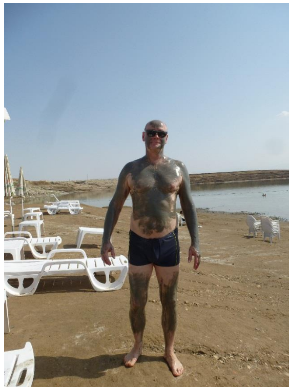
Foto: Zvycajna procedura na brehu Mrtveho mora, liecive bahno