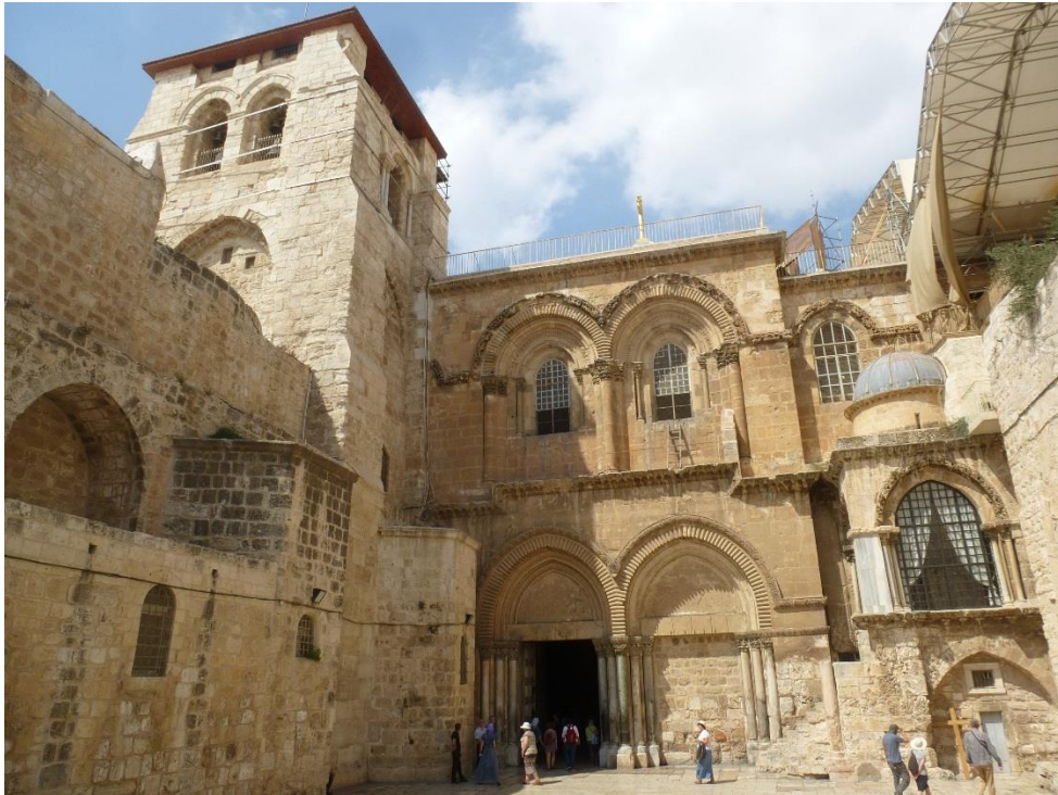
Foto: Nádvorie s vchodom do Chrámu Božieho hrobu

Od Mrtveho more sme pokračovali do Jeruzalema. Este pred vstupom do stareho mesta nas izraelsky kolega najprv vyviezol na Olivovu (Olivetsku) horu, odkial je krasny vyhlad na cele mesto. Olivova hora sa nachadza uz vo vychodnej, moslimskej casti Jeruzalema. Vyhladu dominuje mohutny vychodny mur stareho jeruzalemskeho chramu. Je v nom tzv. Vychodna brana, cez ktoru by podľa zidovskej viery mal vstupit do mesta novy mesias. Zle jazyky hovoria, ze prave preto si moslimska komunita zriadila pozdlz celeho vychodneho mura svoj cintorin. Aby zablokovali vstup do vychodnej brany. Na troskach stareho chramu zniceneho Rimanmi stoji teraz tzv. Skalny dóm a mesita Al-Aksa. Zidia hore nemaju pristup, co je permanentne zdrojom napätia medzi obomi komunitami.