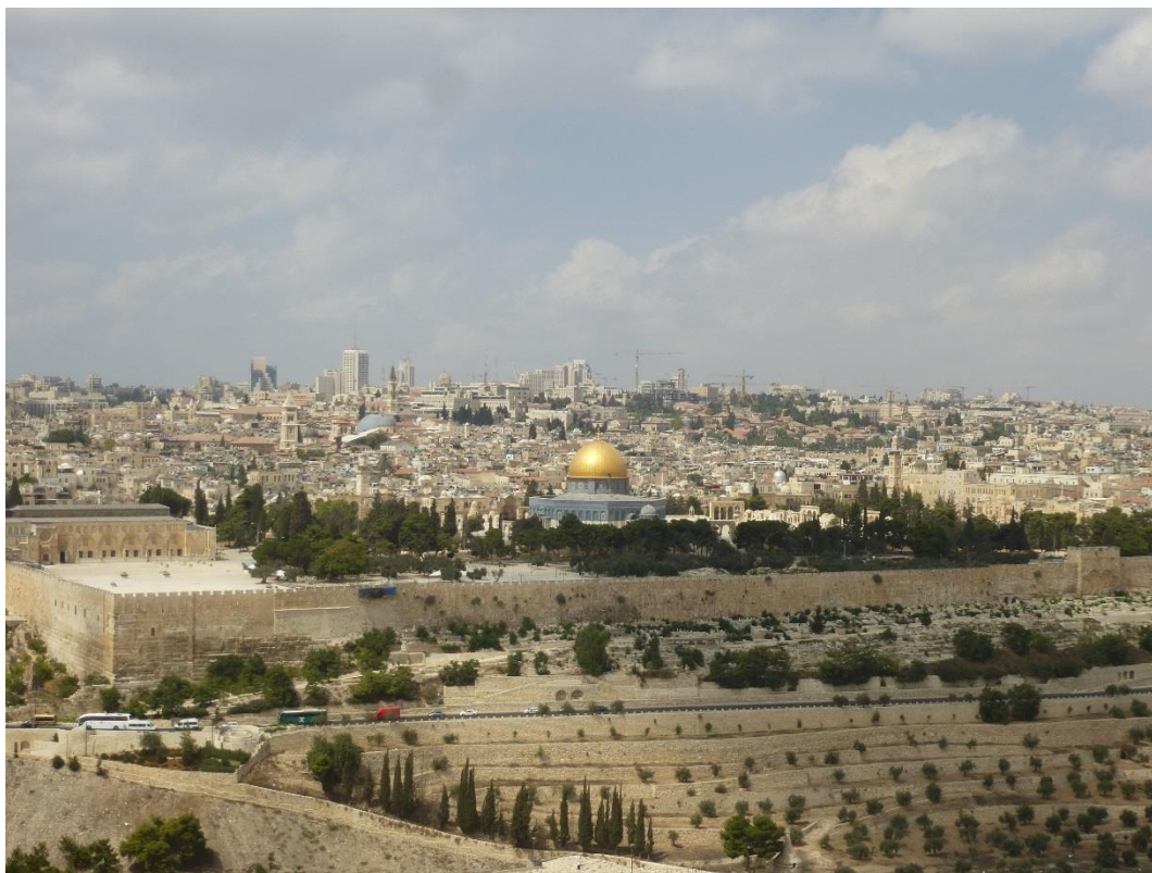
Foto: Panorama stareho Jeruzalema z Olivovej hory, v popredi vychodny mur Jeruzalemskeho chramu