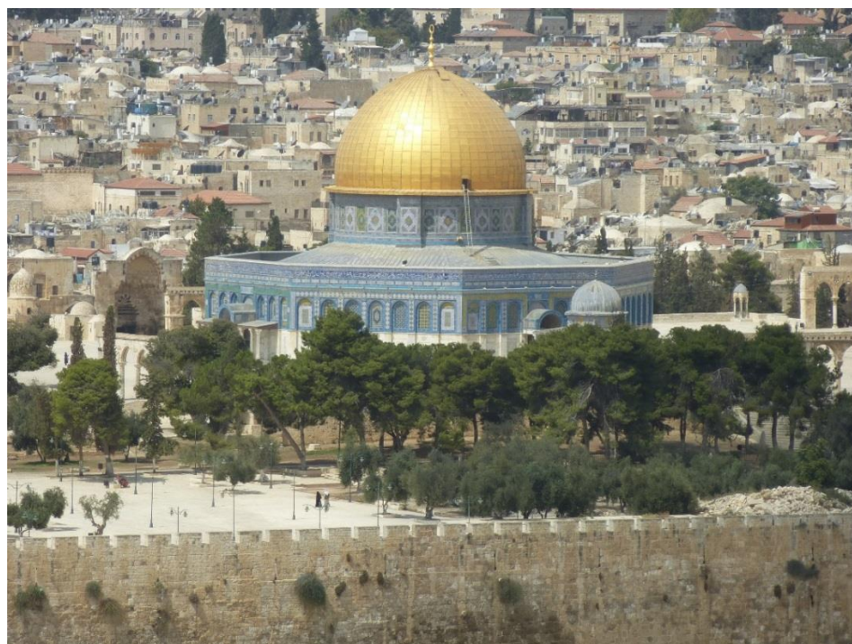
Foto: Skalný dóm na Chrámovej hore