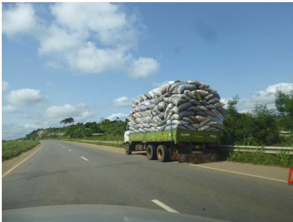
Foto: Tradicne pretazeny nakladak, velmi bezny jav