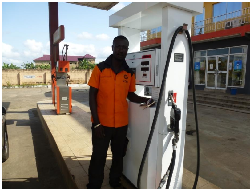
Foto: Na cerpacej stanici

V posledny den mojho pobytu sme este s kolegom mali v Accre audienciu na Velvyslanectve Republiky Guinea pre Ghanu a Togo. Ambasador nas prijal velmi milo, bol to velmi distingvovany clovek. Bavili sme sa o podpore, ktoru nasa firma poskytne zapadoafrickym krajinam postihnutym ebolou, co momentalne boli Guinea, Liberia a Sierra Leone. Vsetko, co sme s velvyslancom preberali, on vzdy niekoľkymi vetami pretlmocil vo francuzstine svojej asistentke, ktore tam sedela s nami a vsetko zapisovala. Zeby protikorupcne opatrenie?