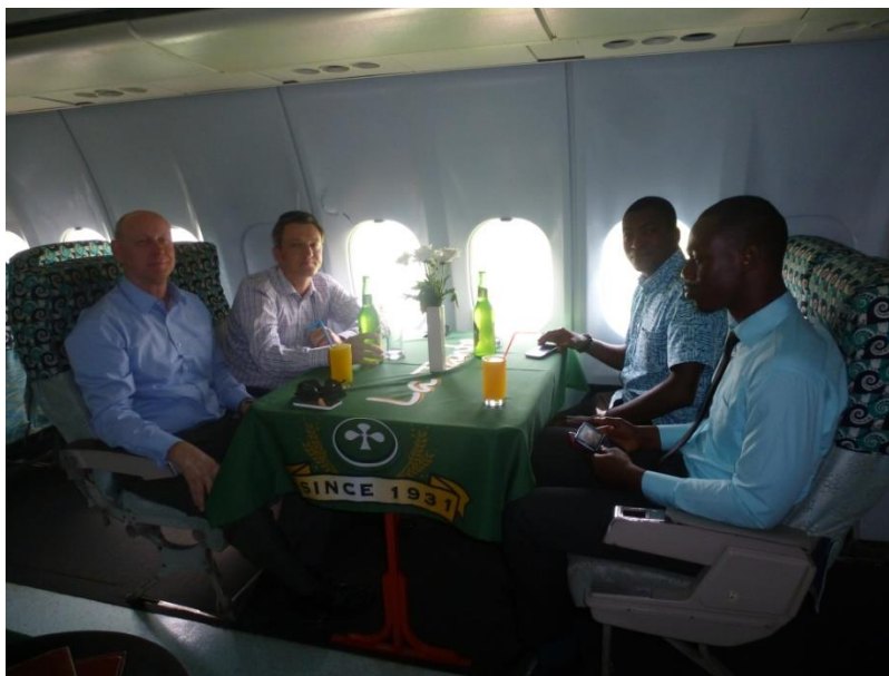
Foto: Nasa partia na obede v stylovej restauracii na palube vyradeneho lietadla nedaleko letiska v Accre. Uz nase tradicne miesto na stolovanie.