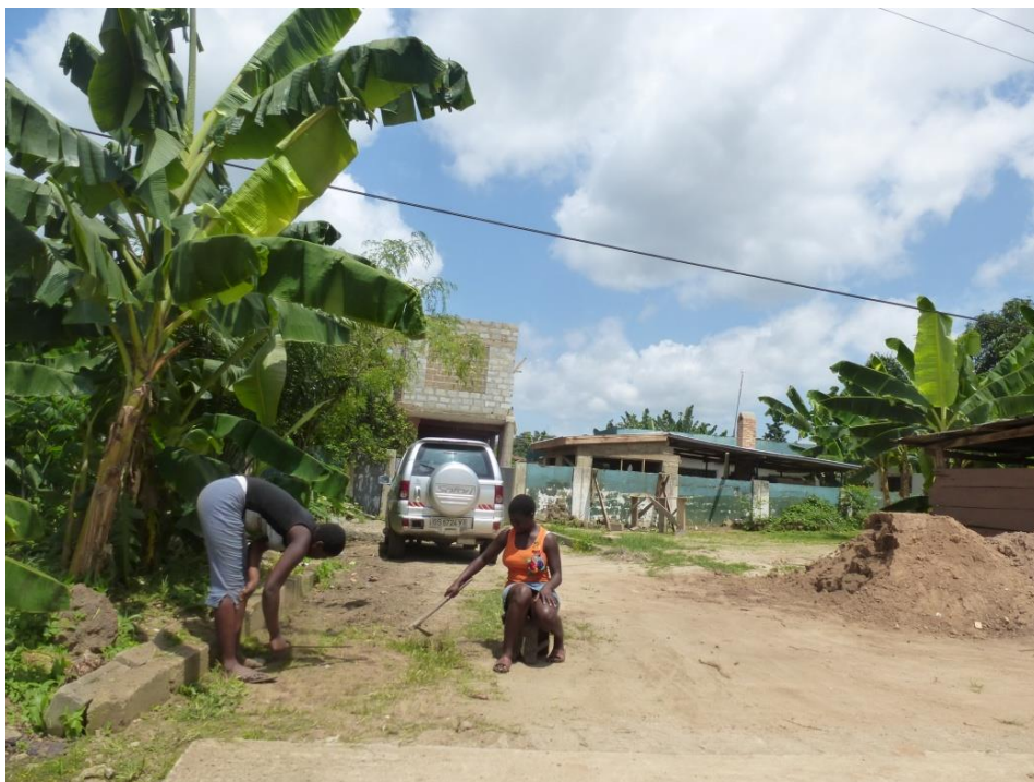
Foto: Udržba okolia