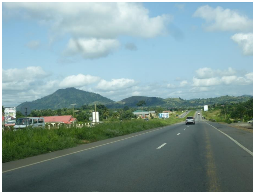
Foto: Cesta smer Kumasi, blizime sa k horam