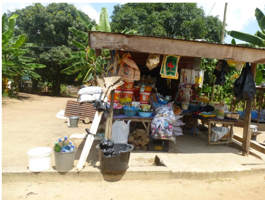
Foto: Tradicny stanok