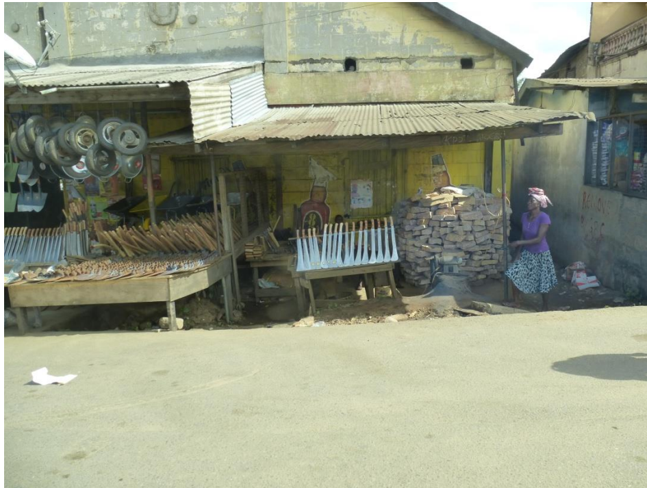
Foto: Obchod s macetami