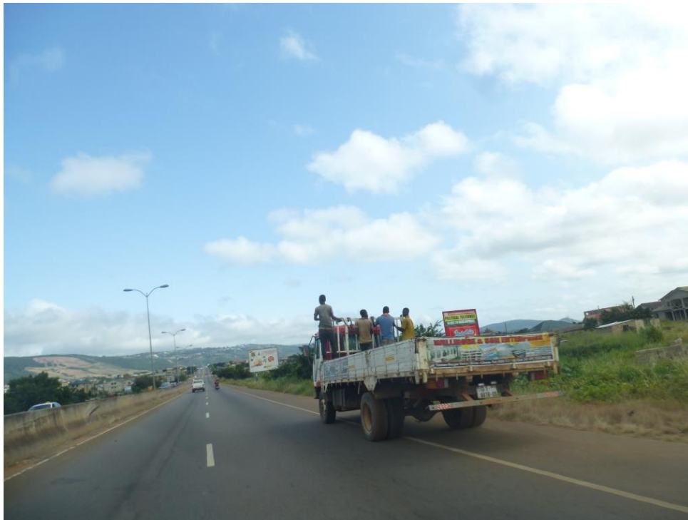
Foto: Preprava osob v miestom podani

Na vidieku v miestach, kde je stale este stojata voda, ponukaju miestne zeny pri ceste nejaky zvlastny druh slimakov. Maju toho plne kose, ktore otrcaju na okoliduce auta. Zaujalo ma, ze mnohe stanky pri ceste ponukaju v malych aj vacsich vreciach na predaj muku.