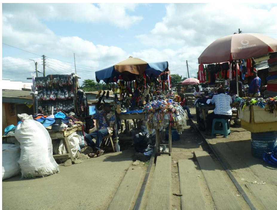
Foto: Na trhu. Kolajnice, ktoré vidno na fotke, su pozostatkom kolonialnej ery. Uz dlho po nich nejazdil žiadny vlak