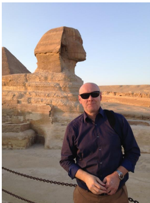
Foto: Pri Sfinge

Sfinga je pojem samo osebe. Telo leva a hlava cloveka. Je velmi stara, zial je vytesana z pomerne nestabilneho materialu, takže je silne nahlodana zubom casu. Ale je v rekonstrukcii, hlavne jej spodna cast, podstavec, je kompletne opraveny. Zial k Sfinge sa neda tesne priblizit. Nizsie pod Sfingou je zadusny chram, od ktoreho viedli pohrebne sprievody k pyramidam. Od sprievodcu som sa dozvedel, ze tento chram nikdy nemal strop, takže bol tvoreny len stlpami a stenami, s volnym vyhladom na oblohu. Kusok bokom sa nachadza aj stary cintorin, kde su pochovani faraonovi uradnici.