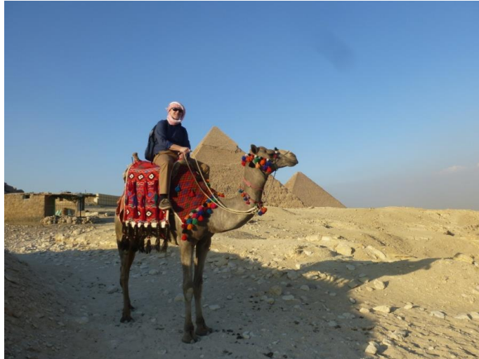
Foto: Jazda na tave okolo pyramid. Neodolal som ponuke.