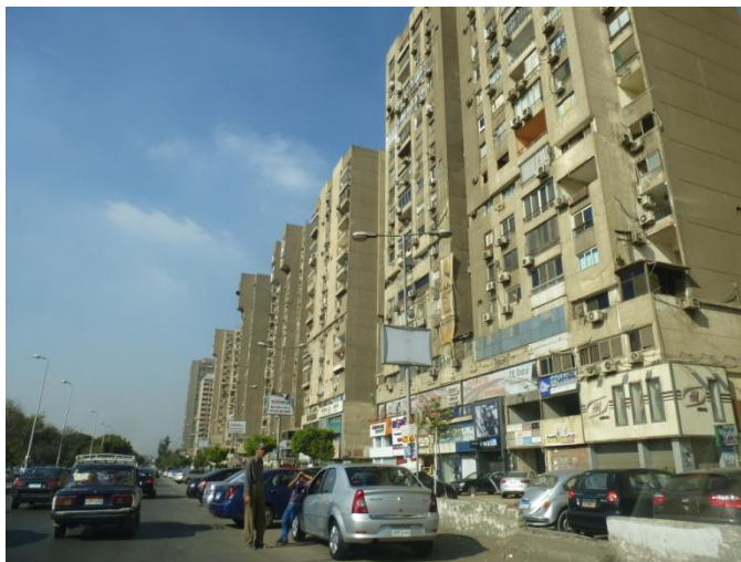
Foto: Typická ulica v stvrťi Nasr City, v okolí hotela Sonesta