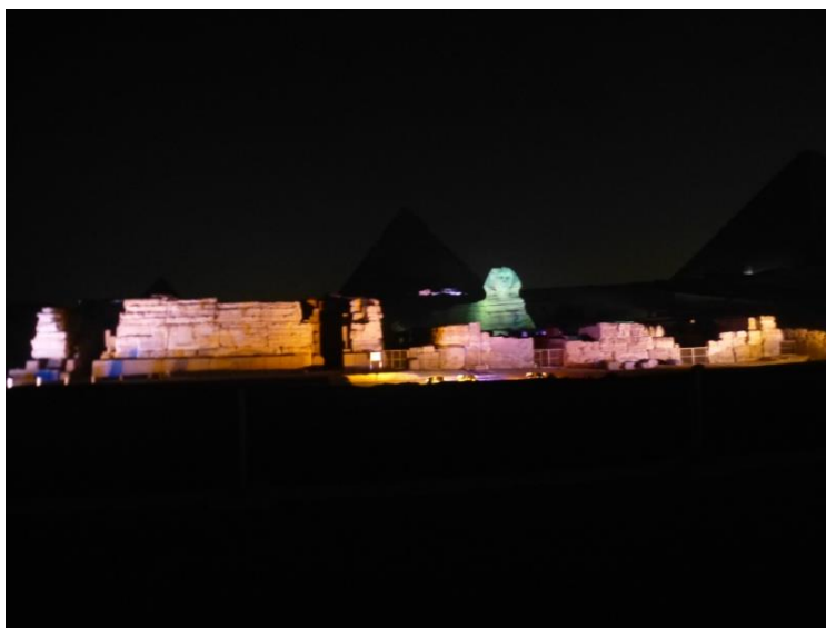
Foto: Spektakularne predstavenie, vecerna „Sound and Light Show“ pri pyramidach

© Text: Róbert Nádaskay