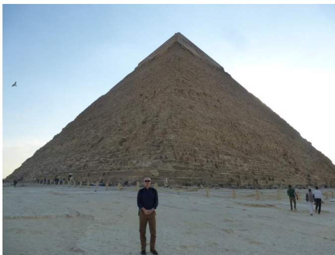
Foto: Konečne pri pyramidách...

Druhý den popoludni som mal trocha voľného času. Chcel som zajst k pyramidám, aspon na chvíľku. Kolegovia mi však doporučili večernú „Sound and Light Show“ pri pyramidách, údajne to stojí za to. Tak som nakoniec so sprievodcom a soferom vyrazil do Gízy. Areal pyramíd majú zatvárať o štvrtéj, my sme tam prišli takmer o pol štvrtéj. Sprievodca mi doporučil zobrať si jazdu na tave okolo pyramíd. Urobil som tak, dobre sa fotilo, aj „dessert guy“ teda majiteľ a pohŕňač tavy mi urobil zopár dobrých fotiek. Samotná jazda nebola bohviečo, je to nepohodlné na sedenie a vytrasie to z človeka dušu. Situácia okolo týchto služieb je zaujímavá: môj sprievodca ma skontaktoval s chlapcom, ktorý postavá pri pyramide. S ním sme dohodli jazdu. Potom prišiel domorodec s tavou, ktorý ma viedol a na požiadanie fotografoval. S ním prišiel mladý chlapec, ktorý fakticky ovládal tavu. Takže v celom reťazci boli zangazovaní styria ľudia, ktorí majú dostať svoj podiel z poplatku a baksisu (aj si ho vypýtali). Typický Egypt (aspon Káhira), stále pýtajú baksis.