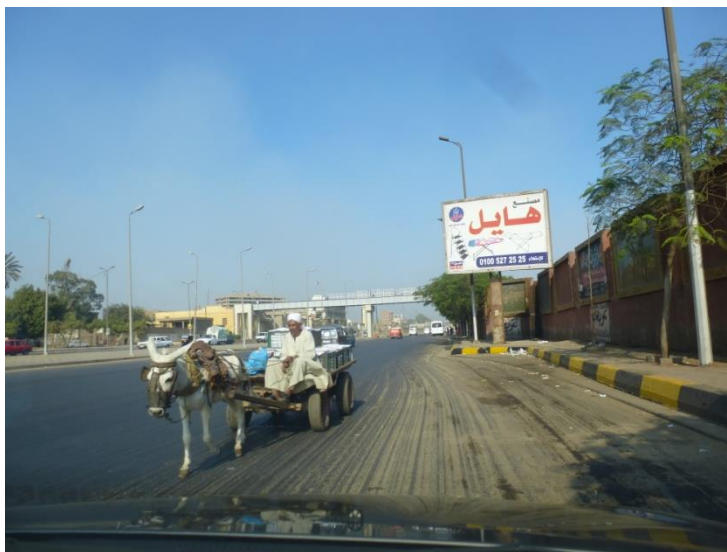
Foto: Tradičný dopravný prostriedok, ale v protismere. Tu sa to stáva často.