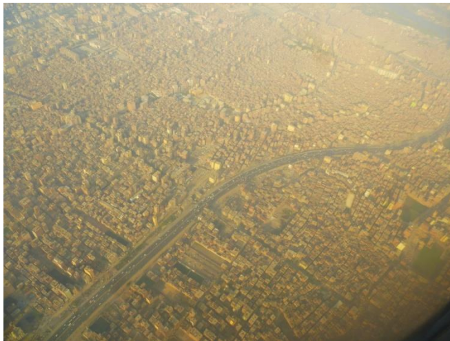
Foto: Pohľad z vysky na cast Kahiry. Cele mesto vyzerá zhora podobne.

Konecne som sa vybral do Egypta. Uz som dvakrat zrusil naplanovanu cestu kvoli zlej bezpecnostnej situacii Kahire. Tentoraz sa to podarilo zrealizovat. Priamy let z Viedne s Austrian, prichod do hotela Sonesta vecer. Dal som si prechadzku po uliciach okolo hotela, hoci uz bola tma. Ale zdalo sa to tu byt bezpecne. Siroke ulice, plne aut, obchodov a vysokych obytnych domov. Vyzeralo by to celkom dobre, keby tu nebolo tolko prachu a spiny. Mnozstvom neporiadku a odpadkov v uliciach sa Kahira vyrovnava metropolam v zapadnej Afrike, ale tu je asi este viac prachu. Pustny prach je vsade. V Kahire prsi tak dvakrat za rok, v zimnom období.