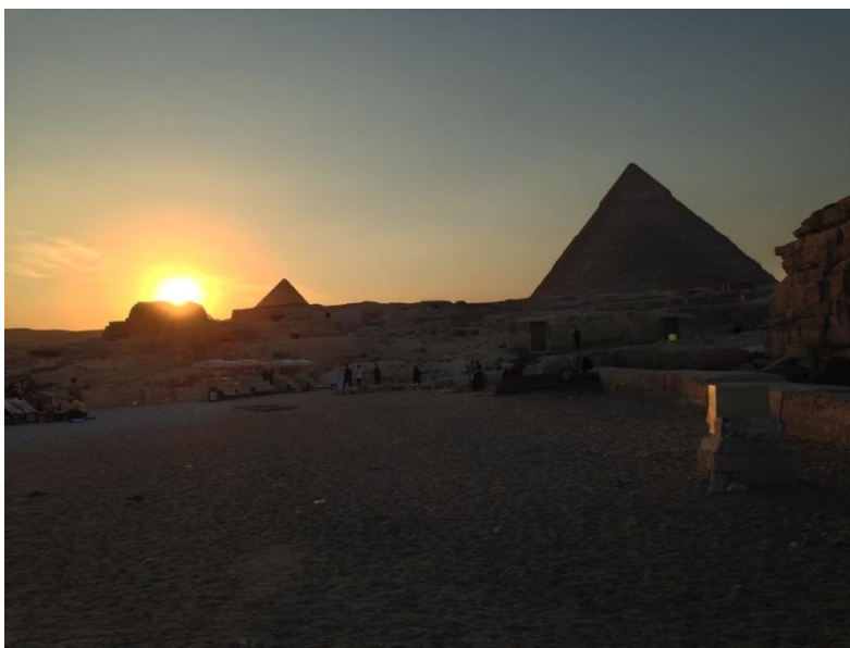
Foto: Den sa konci, slnko zapada za pyramidy

Areal chramu pri sfinge som opustil ako posledny navstevnik v tento den. Bola uz takmer tma, stmieva sa tam velmi skoro, uz o piatej.