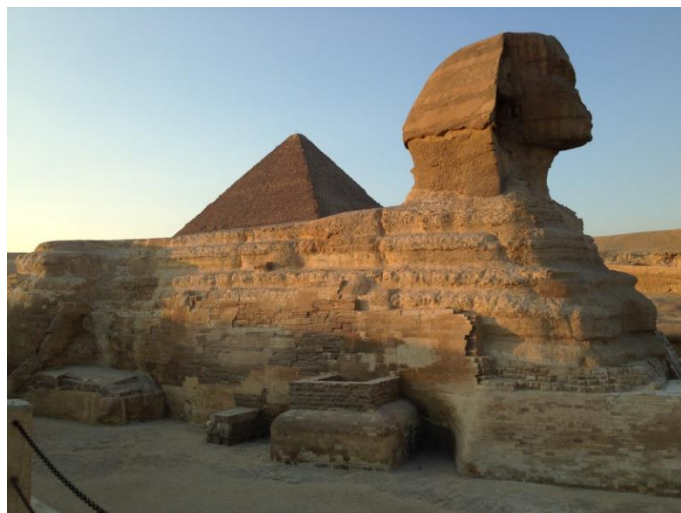
Foto: Sfinga s Cheopsovou pyramidou v pozadi.