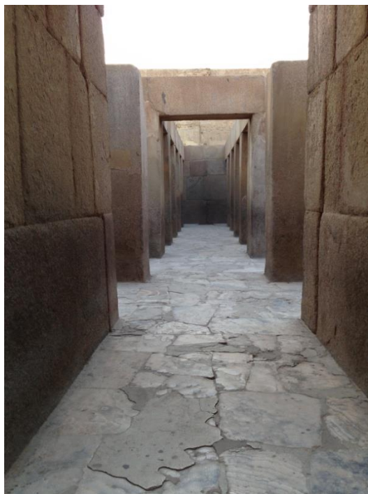
Foto: Chram pri Sfinge. Odtialto vychadzali pohrebne sprievody k pyramidam