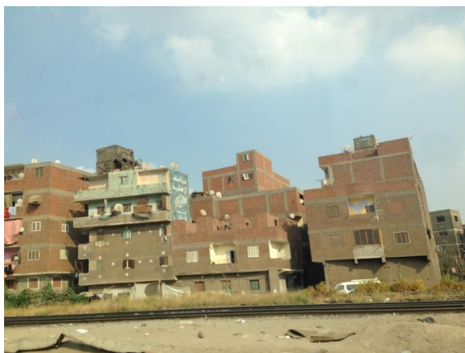
Foto: Obytné domy v Kahire. Takto vyzera vacsina mesta.

Zvláštnu kapitolu tvorí dopravná situácia. V Kahire žije asi 17 miliónov obyvateľov a každý deň prichádzajú za prácou z okolia ďalšie štyri milióny ľudí. Doprava je katastrofálna. Ako povedal môj miestny kolega, neplatia tu žiadne pravidlá. Proste sa ide. Jazdne pruhy nikto neberie do úvahy, väčšinou ani nie sú vyznačené. Autá jazdia krížom-krážom, niekedy aj v protismere. Obiehajú sa zľava aj sprava, ako to vyjde. Keď minibus potrebuje zastaviť, aby nabral ľudí, urobí tak hoci aj v strede cesty, čo na tom, že takmer zastaví dopravu. Všetci v kuse vytrubujú, hlavne aby zabránili zrazke, ale niekedy aj pomerne bezdovodne. Chodci vbiehajú na cestu hocikde, prechody sú len iluzórne. Prakticky všetky autá sú otlčené spredu, z boku aj zozadu. Nevidel som snad jedno neporušené auto. Niektoré vysluzilé exempláre nemajú ani svetla, všetky sú porozbíjane. Jazdia tu aj tuk-tuky v thajskom štýle, hoci podľa kolegových slov sú ilegálne. Mesto má aj metro, ale jeho linky a kapacita nie sú dostatočné.