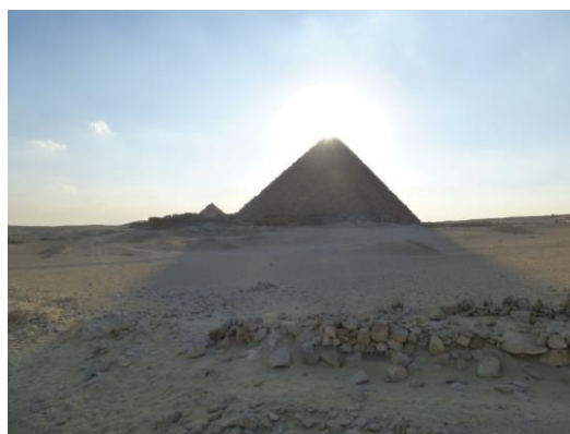
Foto: Slnko sa dotyka vrcholku Menkaureho pyramidy. Ra alebo Aton...?