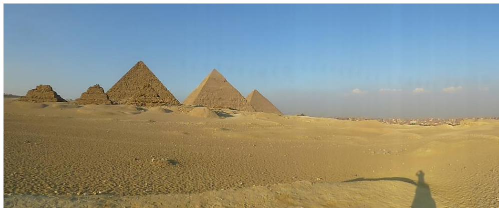
Foto: Celkový pohľad na pyramídy v Gíze. Sprava doľava: Cheopsova, Rachefova, Menkaureho. V popredí tri malé pyramídy manželiek.

Okolie pyramíd v Gíze na mňa urobilo pomerne silný dojem. Bol som tam pred- a počas zapadu slnka, takže to malo zvláštne čaro. Pyramídy sú monumentálne, škoda, že sa na nich nedať vyliezť. Este pred dvadsiatimi rokmi to bolo povolené! Ale môžete prísť celkom blízko a dotýkať sa ich. Sú tam tri veľké a tri malé pyramídy, najvyššia je Cheopsova (Chufu), ďalej Rachefova (Khafre) a Menkaureho pyramída. Tri malé pyramídy patria ich manželkam.